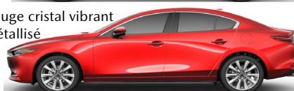
Rouge cristal vibrant métallisé