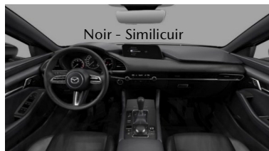
Noir - Similicuir