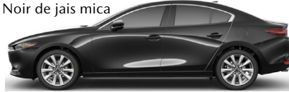
Noir de jais mica