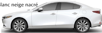
Blanc neige nacré