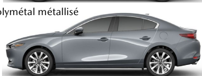
Gris polymétal métallisé