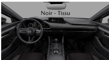
Noir - Tissu