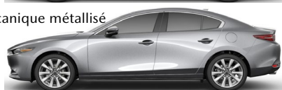
Gris mécanique métallisé